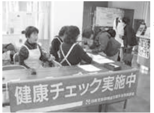
大勢のスタッフでスムーズにできました

今回はセンター利用者の方も受けられました。また、事前に行われた「協働センターまつり」にチラシをまいた事、施設の周りの住宅にポストイン、十一月ひまわりに折り込みと、社協関係にと様々な方法で宣伝を行いました。参加者は男性二十七%、女性七十三%、平均年齢七十四才。最高齢者八十八才、最少は四十九才でした。