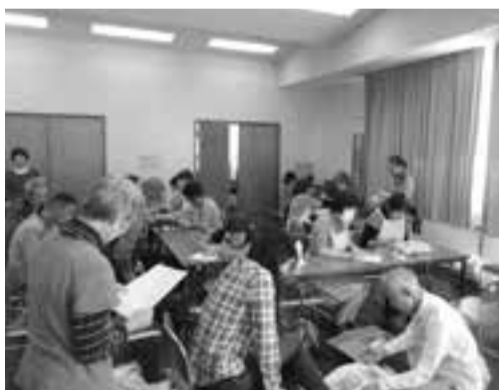
54人もチェックを受けました