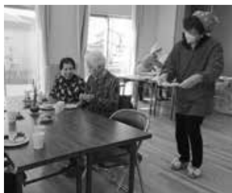
「甘酒も、みそ汁もいいね」