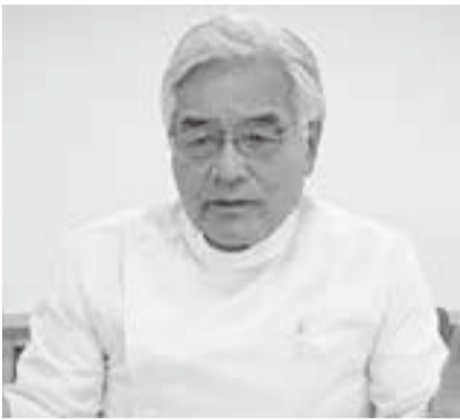
元 間間 所長 診療所はたまき協生

の先輩医師からは「医療生協は楽だよ。医師の仕事だけやっていたらいいから」と言われ、それが一番の魅力だと考えていました。ただ、役員になるとそういうわけにはいかない面もありますが。本来の医療生協の持っている魅力は（医師など専門職は）医療や介護に専念できること。組織された組合員の利用によって、利益中心でない、患者本位の無理のない安定した経営が可能になることだと思えます。ここに来て二十年になります。組合員、患者にとつて何が大切かと思つてやってきました。地域の人々との関わりで、広い視野で医療活動を見ることができま