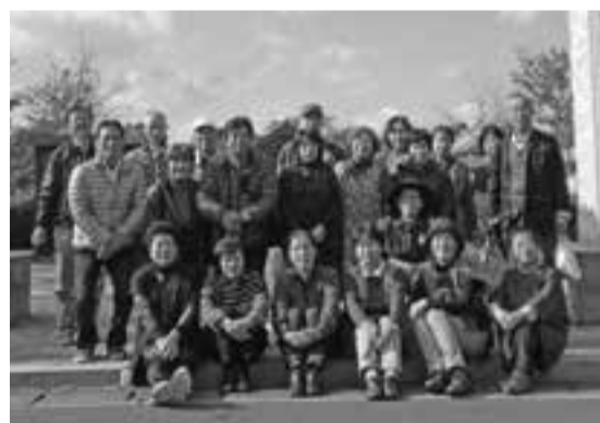
大覚寺(焼津)を参拝しました