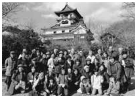
国宝犬山城と一緒に

一番楽しかったのは、往復の車中での、子供たちのなぞなぞとクイズでした。後期高齢者も一緒に考えて、答えたり、降参したりと大笑いで過ごしました。