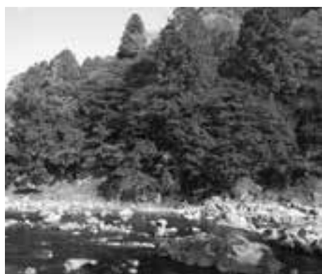
紅葉も見頃でした