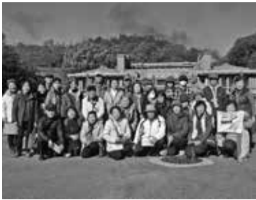
帝国ホテルの前で